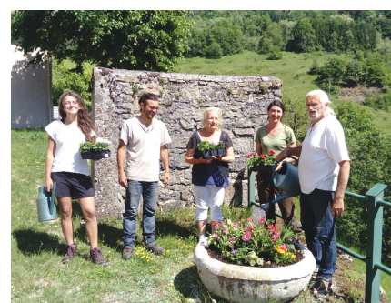
Plantation des bacs par les bénévoles