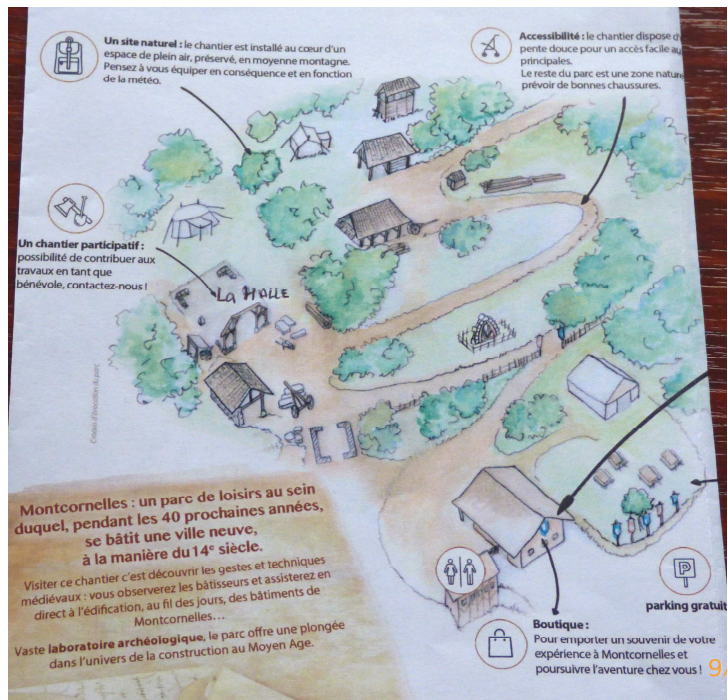
Plan du chantier actuel.

Dans un premier temps les portes sont ouvertes les mercredis, samedis et dimanches de 10h30 à 18h30.