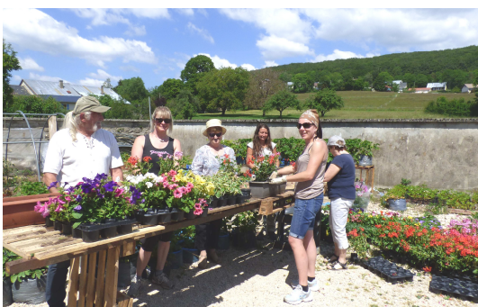
Préparation des jardinières