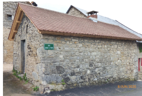
Finition en tuiles écailles chevreaux

La réfection de la toiture a été faite par l'entreprise l'Herminette pour un montant de 9 180 € HT. La reprise des joints des murs se fera en septembre par l'entreprise Simonetta, l'entreprise PST terminera les abords une fois les murs terminés.