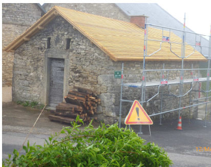
Charpente de la toiture